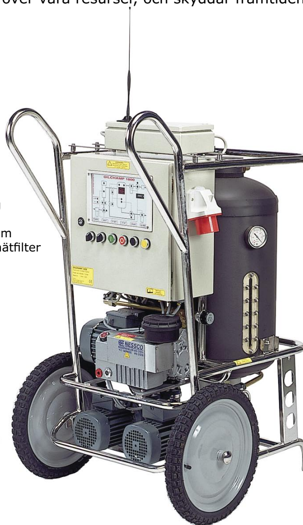
Maskinen på bilden är extrautrustad med GSM-larm