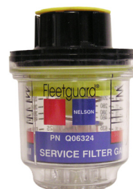
Gradert visuell indikator type 3946328

Med FilterMinder kan du slutte å lure på om luftfilteret er tett. Filter Minder gjør det enklere å vite når det er nødvendig med service på luftfilteret. FilterMinder viser alltid hvor tett luftfilteret er selv når motoren er av. Hyppig service på luftfilteret er også skadelig, da det hver gang vil komme litt støv inn i motoren. På de fleste motorer kan man skifte luftfilter ved et undertrykk på 25" VS. For god drivstofføkonomi anbefaller vi filterskift ved 20" VS.